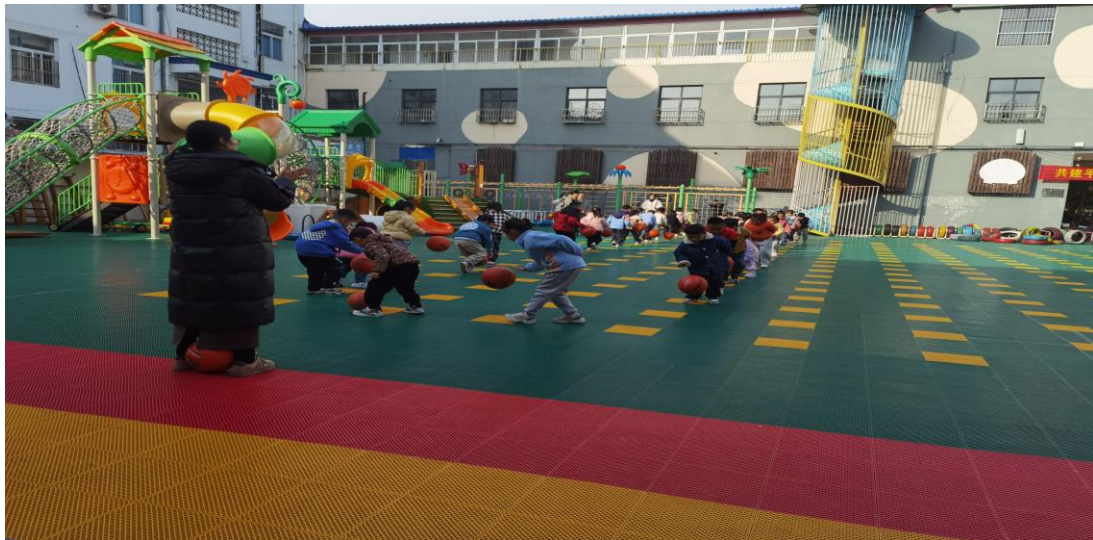
大班“练球操”，花样繁多，队列变化丰富，动作整齐划一，充分展现了大班哥哥姐姐的榜样形象。

每个年龄段的早操，都彰显活力早操、快乐运动、积极向上的精神风貌。全场活动既有变化又有统一，领操老师自始至终都以饱满的精神感染着幼儿。