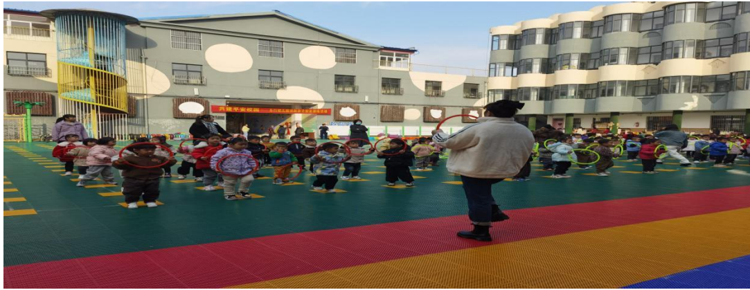
小班“呼啦圈器械操”，韵律清晰、节奏明快、动作简单有力。