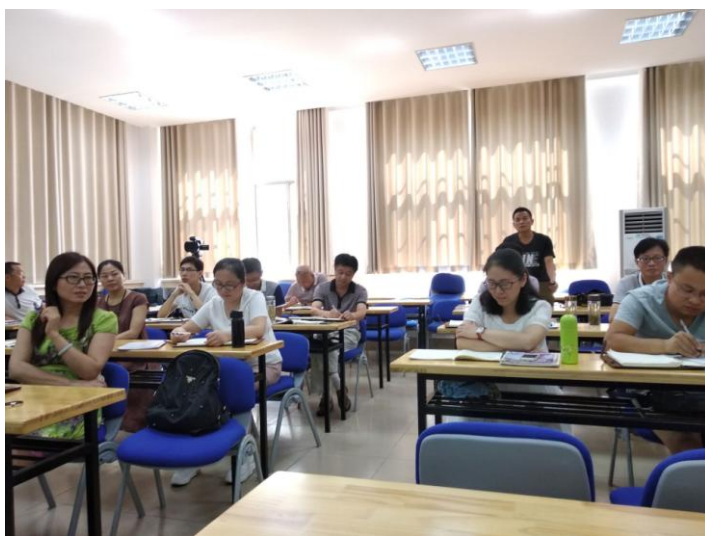
老师们在认真聆听讲座

2018年8月16日，国培计划（2018）——安徽省乡村教师培训团队研修项目淮北师范大学初中语文班研修成员，有幸在淮师大新阶102多媒体教室聆听了江苏省特级教师，正高级教师，南师大硕士生实践导师袁源的讲座。讲座的题目是《给孩子一副好口才——核心素养背景下的初中“口语交际”教学漫谈》。袁老师博学善思，温文尔雅，她的言行举止无不自然流露出发自内心的对人的爱与尊重。她以培养人的核心素养为己任，甘做一名傻傻的语文老师。她以圆润动听的语言娓娓道来，不仅以其高屋建瓴的讲解，提高了学员们对初中“口语交际”教学的认知，更以其崇高师德感染着学员们。