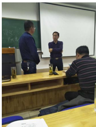
马哲锐老师课间和学员交流教学中的困惑