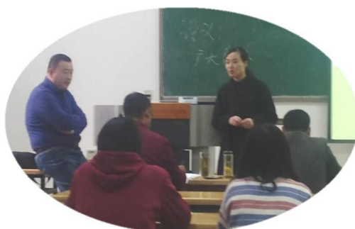
班主任课前与学员的亲切交流