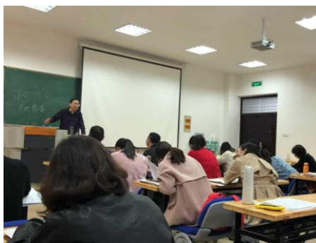
马哲锐老师用激昂深切的语气给学员们上课。