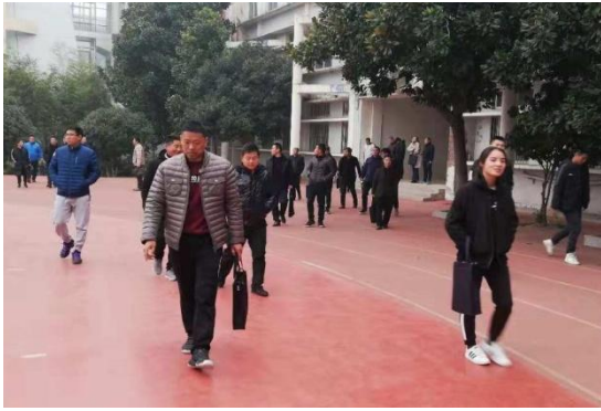
热情洋溢的学员们