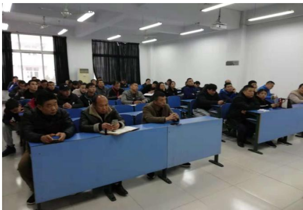
认真聆听的学员们