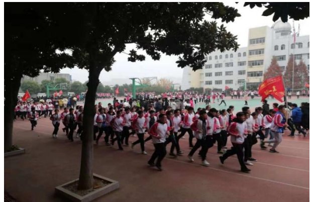
井然有序的跑操队伍

淮北师大附中的大课间操做的比较规范，虽然场地小，但是跑操的队伍整齐划一，口号声音洪亮。跑操的密度和强度都比较适中。通过观摩让学员们感受到了只要我们认真去组织好课间操，场地的大小和体育设施不是主要问题，只要发挥我们的智慧一定能让我们的学生达到体育锻炼的目的，为我们的校园体育锻炼贡献一份力量，为孩子们成长做出一份贡献。