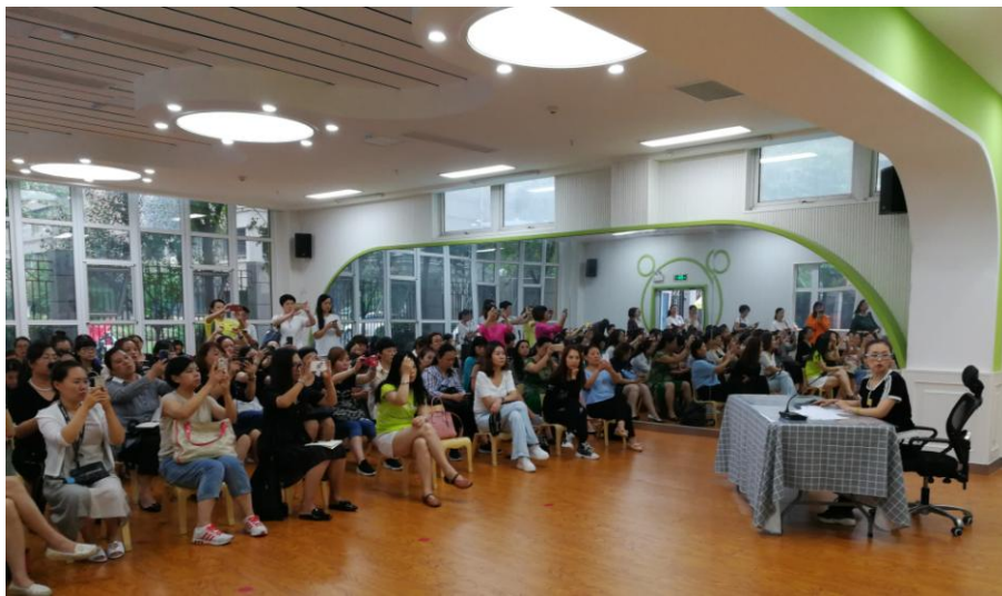
丽城分园园长进行幼儿园办园情况介绍