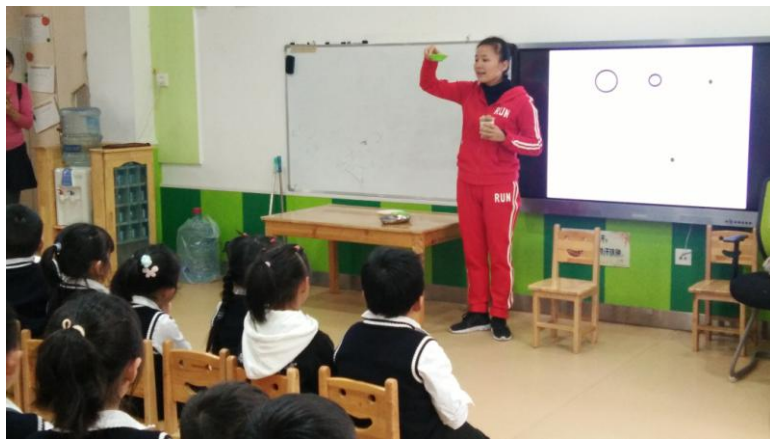
华城的青年教师为大家展示集体教学活动