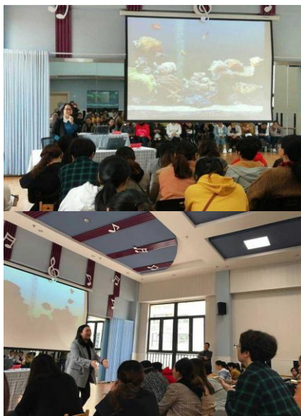
教师们就集体教学活动展开讨论